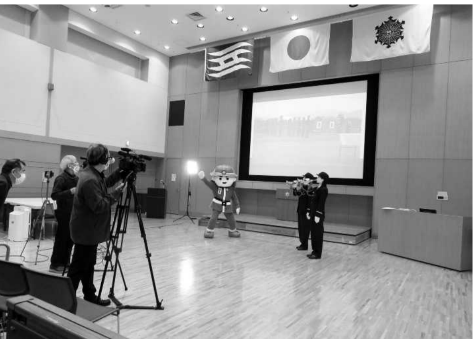
消太くんの指揮のもと、ラッパ演奏