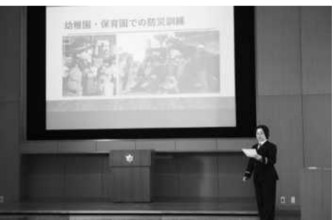
活動事例発表の様子