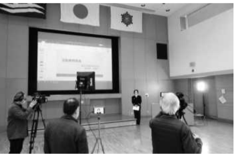
活動事例発表リハーサル中

この度の女性消防団員活性化研修会は、新型コロナウイルス感染症の影響により、参加開催は中止となりました。しかしながら、県内女性消防団員の皆さまや関係者の皆さまに、コロナ禍においても多くのことを学んでいただき、今後の活動に活かしていただきたいという思いから、動画撮影を行い後日YouTubeにて限定配信する方式で実施しました。