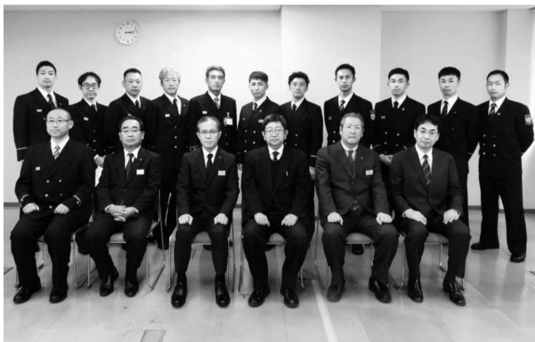
県幹部と共に記念写真

そして新しく着任された皆様、県民の安全・安心のため、そして消防防災力強化のため、