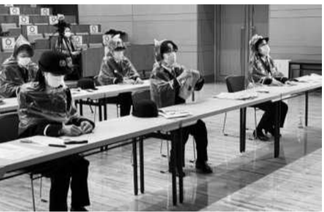
ゴミ袋で雨合羽、新聞紙でスリッパを作成