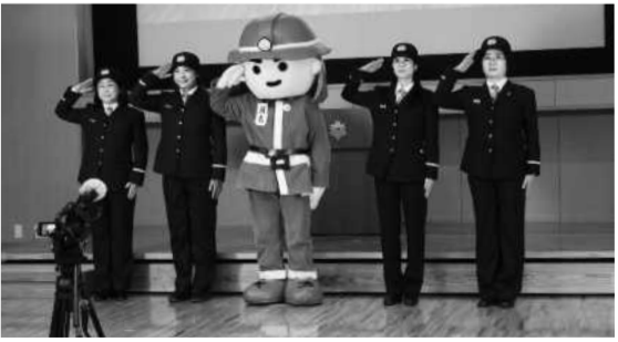
最後は消太くと一緒に「敬礼！」

撮影した内容については、後日編集を行い、兵庫県消防協会のYouTubeチャンネルにて、兵庫県内の女性消防団員等へ限定配信しております。 最後になりましたが、撮影当日は兵庫県加古川市消防団女性分団の皆さまのご協力があり、スムーズに撮影を行うことができました。この場をお借りしてお礼申し上げます。ありがとうございます。