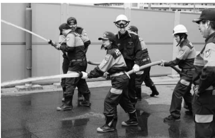
放水技術を高める女性消防団員