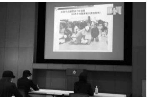
オンライン講演の様子