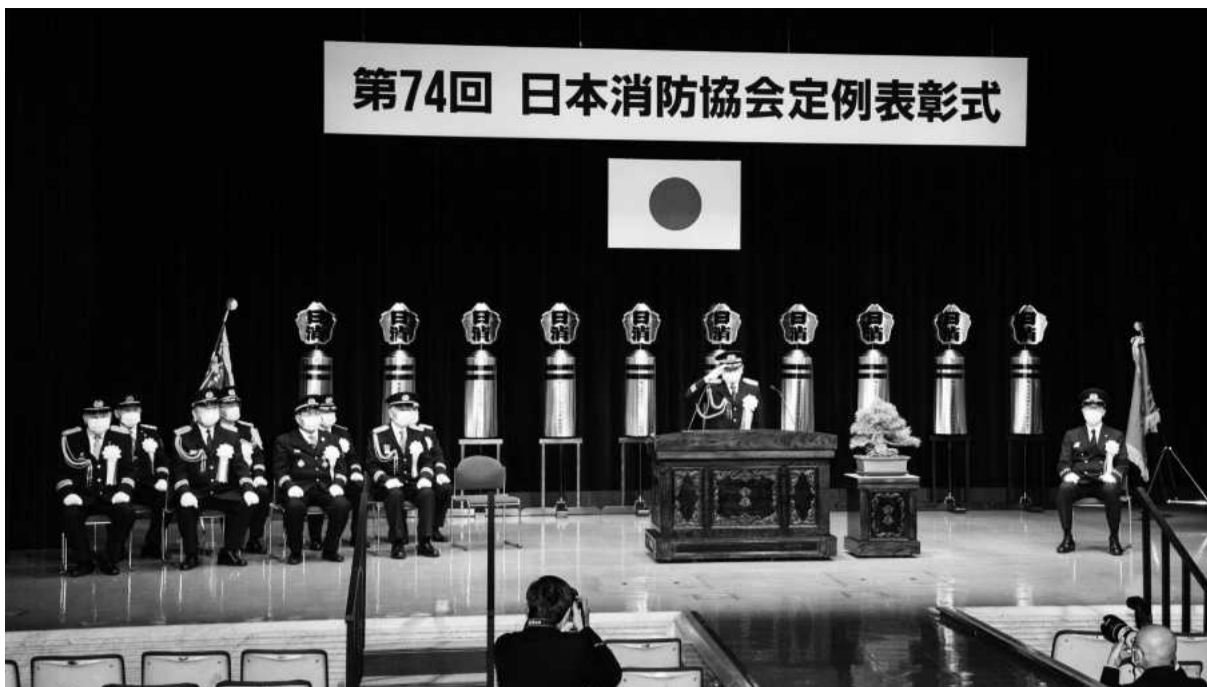
第74回日本消防協会定例表彰式

令和四年三月四日、ニッショーホール（東京都港区東新橋）において、第七四回日本消防協会定例表彰式が挙行されました。 新型コロナウイルス感染症の影響により、大幅に規模を縮小し、代表受領等関係者のみで行われました。