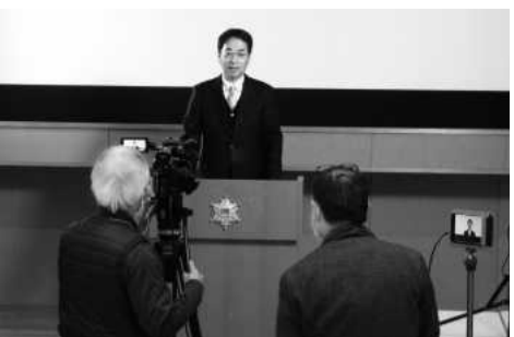
事務局長（消防課長）挨拶