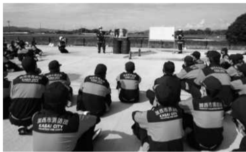
火災性状が理解し易かったと団員間でも好評。

この実験は、燃焼のメカニズムや火災性状を科学的に学び、効果的な消火技術を習得することを目的としたもので、リアルな家屋模型を燃やすことで実火災のイメージ化ができ、煙や火災の動きから、どこに筒先を配備し、どう放水するのか、消防署員の解説を受けながら熱心に学びました。