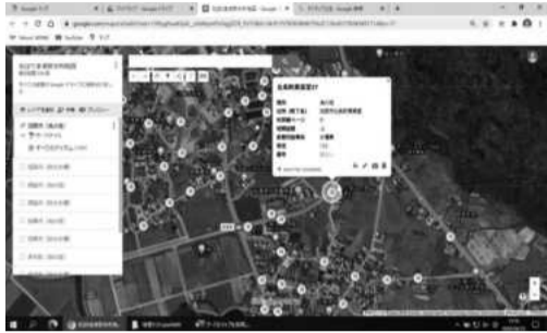
スマホから瞬時に水利情報を把握できます。

火災時にいち早く水利を確保することは、消防団員の重要な任務になります。全団員に水利地図を配布することは困難で、水利の新設置・廃止の際は、地図更新の課題もあり、水利の把握については、日頃の水利点検等個人個人の努力に頼らざるを得ない状況でした。そんな問題を解決したのが、スマホアプリの Google マップで作成した加西市水利マップです。当アプリの機能を活用し、加西市内の消火栓・防火水槽約二、二〇〇箇所のデータをオンライン上に