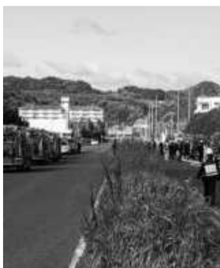
緊急消防援助隊近畿ブロック合同訓練の様子

内では活躍する女性をたたえる「ひょうご女性未来・縹(はなだ)賞」にも選ばれました。本部所属となる女性消防隊は愛称「しずかファイアーズ」として火災予防活動、応急手当普及員を養成しての講座など日頃より災害時の後方支援に備え活動しています。