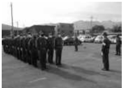
新入団員礼式訓練

しかし、昨年の一二月には新型コロナウイルス感染症の拡大が少し落ち着いてきたことにより、令和二年度から開催ができていなかった、新入団員等研修会を開催いたしました。