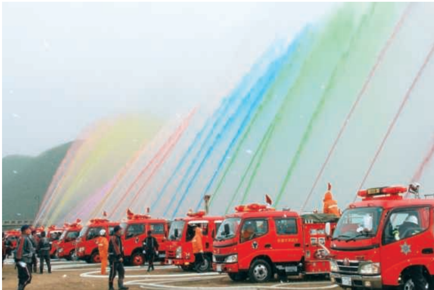
赤穂市消防出初式一斉放水