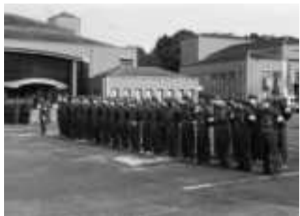
分団長・新入団員礼式訓練

平成一一年四月一日に、旧多紀郡篠山町・西紀町・丹南町・今田町の四町合併により、篠山市が発足、令和元年五月一日には丹波篠山市へと市名変更となりました。