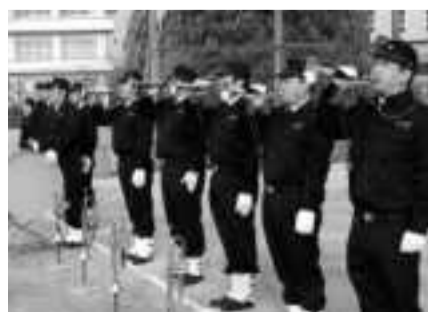
ラップ隊による吹奏の様子

【最後に】一九九五年一月一七日五時四六分、旧北淡町を震源とするM七・三震度七の地震(兵庫県南部地震)が発生。激しい揺れにより、死者・負傷者、家屋の倒壊と甚大なる被害に見舞われました。