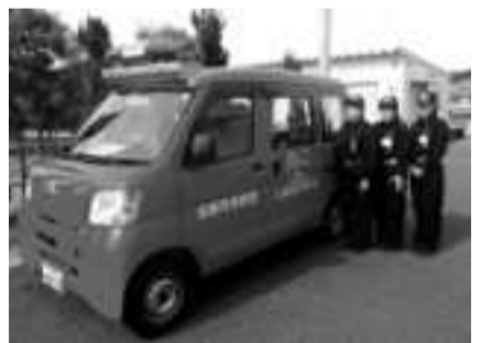
女性隊による防火パトロールの様子

消防団は本部をはじめ旧町から継承した五地区の団組織(二五分団)で構成され、約一、七〇〇名の団員が在籍、年頭の初出式を皮切りに幹部新入団員合同訓練、操法訓練、防災訓練、防火啓発、年末の特別警戒と年間を通じて多様な活動を行っています。