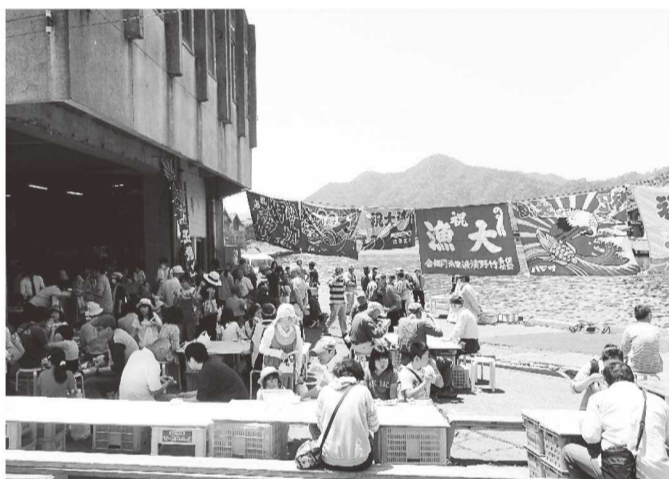
多くの来場者で賑わう海町マーケット

豊岡市竹野町は、日本海に面した兵庫最北端の町です。町の中央を流れる竹野川は、南部の山岳地域と北部の海岸地域をつなぐ一町一川の河川です。竹野町では、自然あふれる町の特性を活かした林業・農業・漁業・観光業が主な生業として営まれてきました。竹野海岸は、海面変動や地殻変動により、複雑に入り組んだ形状のリアス式海岸が特徴で、その海岸地形は多くの魚などの水産資源を育み、小型船を使った漁業（刺し網、磯見、定置網、一本釣り）が盛んに行われて