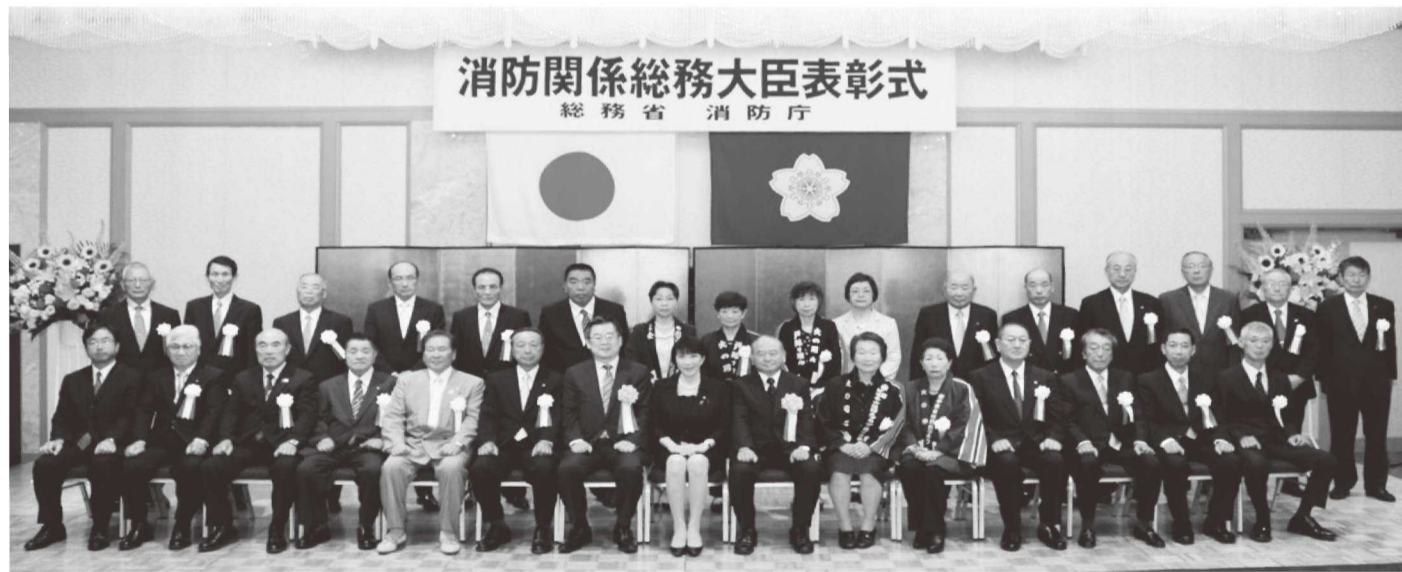
安全功労 個人の部