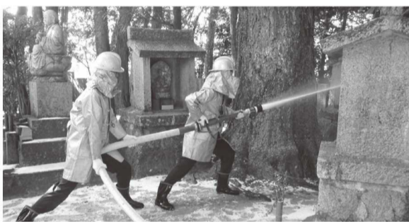
火元へ向けていざ放水

文化財防火デーの普及を目的に、洲本消防署と連携して林野火災防衛訓練を実施しました。訓練では中継送水訓練及び兵庫県消防防災航空隊によるヘリの散水訓練も行われました。