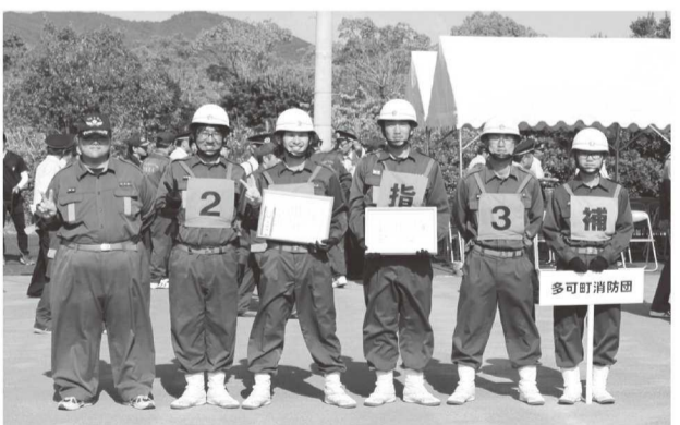
昨年度、県大会準優勝の坂本部・横屋部

多可町消防団は、平成一八年、加美町消防団、中町消防団、八千代町消防団が合併して発足しました。当初から多可町消防団としての融合が課題でしたが、それまで積み重ねてきたそれぞれの団の良き伝統を受け継ぎながら、合併した町の消防団としての歴史を紡いでいます。