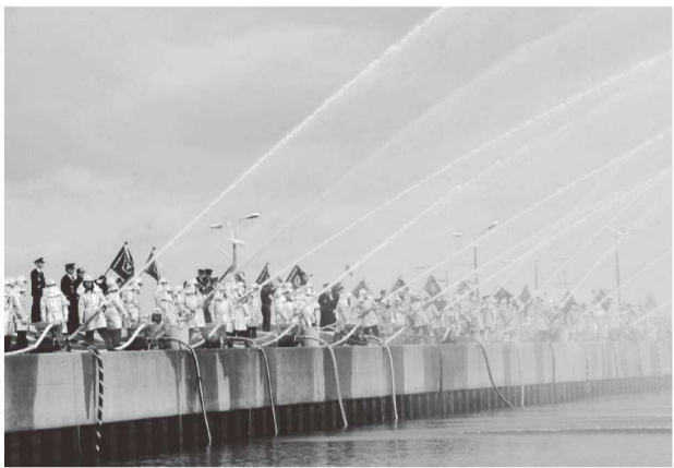
洲本港における一斉放水

消防団の士気高揚と地域住民の防火意識の向上を目的として、年頭に消防団出初式を実施しています。例年、式典後には洲本港において色水を利用したカラー放水を実施し、消防団活動をアピールしています。