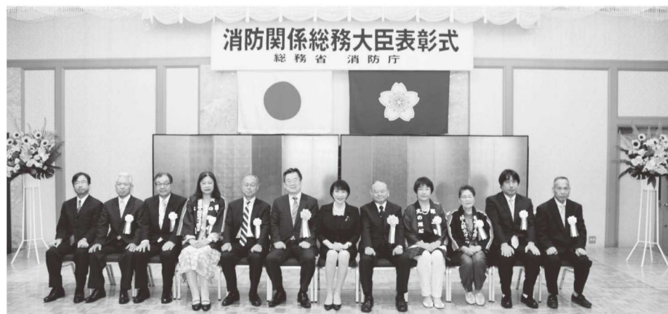
安全功労 団体の部