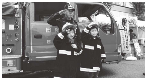
団員と一緒に敬礼

PRのため、地域イベントに参加し、消防車両の乗車体験や消防団の活動内容などを展示ブースで紹介しています。子ども用の防火衣を着用しての消防車両の乗車体験は大変人気となっています。