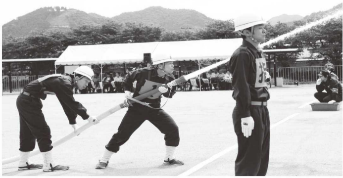
今年の町操法大会の様子

千名を超える体制ではありませんが、ご多分に漏れず、昼間の団員不足と団員の高齢化、団員数の減少により団員の確保の難しさという課題が大きくなっています。団員の減少から一つの部でチーム編成が難しい