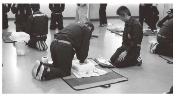
心臓マッサージががんばってます