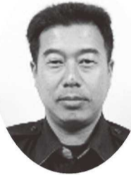
私がウィットです

市川町は、兵庫県の中央部からやや南西部に位置し、町の中央部を町名の由来となっている清流・市川が流れる伝統と緑豊かな町です。