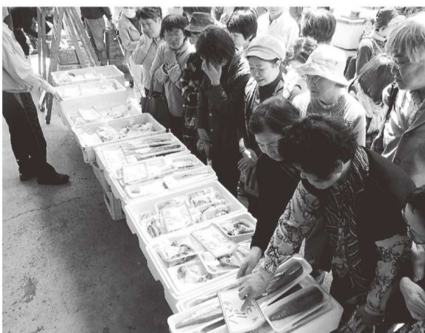
並べられた海産物を選ぶ来場者

太子町は、新たなまちづくりの拠点として、新庁舎を平成二七年九月に開庁しました。交流広場を中心に行政棟、議会棟、交流棟の三つのゾーンで構成し、「太子の環」人がつながる」をコンセプトとして、行政サービスの提供にとどまらず、まちに対して様々な機会を生み出す柔軟性のある場となるよう、時代の変化に対応した太子町の核となる施設です。