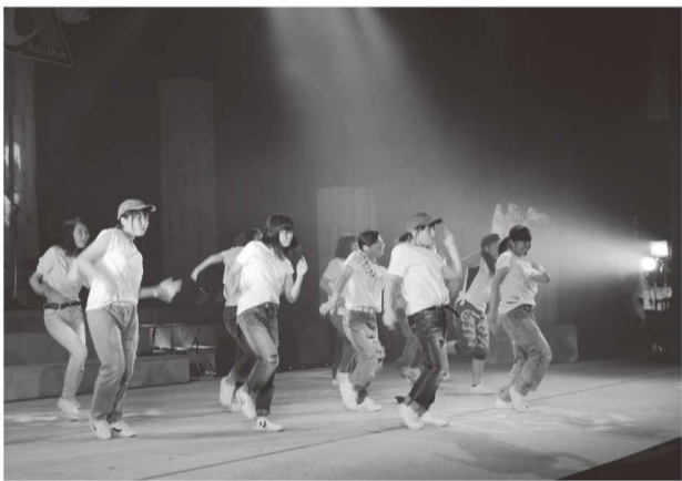
LIVE in ASUKA 歌やダンスなどの住民パフォーマンス