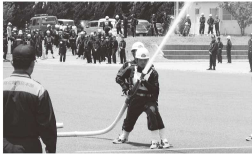
火点に向けて放水開始