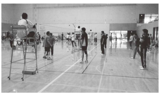
日頃の運動不足を解消!!

団員の健康増進事業の一環として、ソフトバレーボール大会を隔年に実施しています。健康管理はもちろんのことですが、分団内での団結力やコミュニケーションの強化、分団を超えての交流を通じて消防団全体の団結力強化にも役立てています。