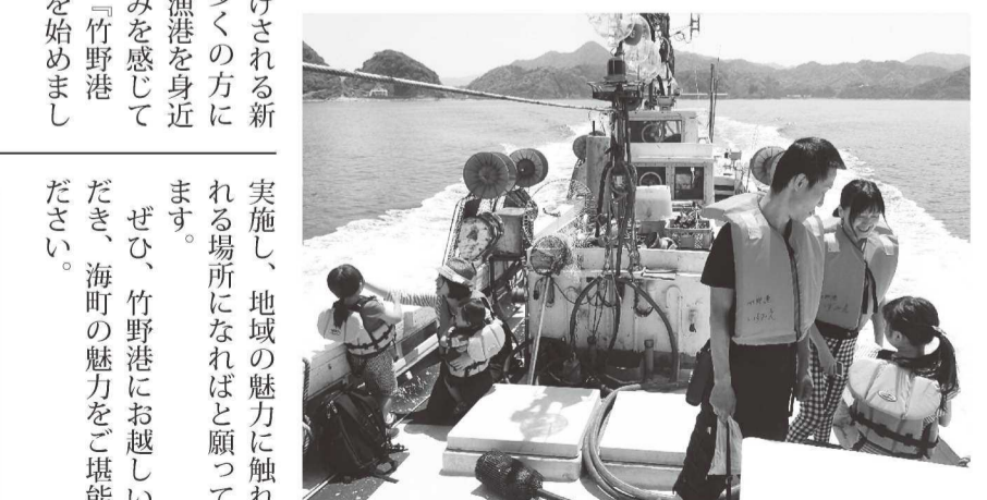
プチ遊覧船で海からの眺めを楽しむ家族

きました。しかし、産業構造の変化や食文化の低迷、後継者不足等によって、漁業は衰退しつつあります。このような状況を少しでも改善し、地域の漁業を守るために、漁業者と漁業協同組合が中心となり、住民の協力を得て、昨年からは鮮魚直売市を始めました。さらに、今年四月からは、竹野港に水揚げされる新鮮な魚の魅力を多くの方に知っていただき、漁港を身近な場所として親しみを感じていただけるように『竹野港 海町マーケット』を始めました。