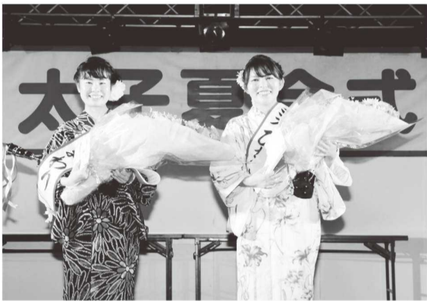
太子夏会式 恒例のミスひまわりコンテスト