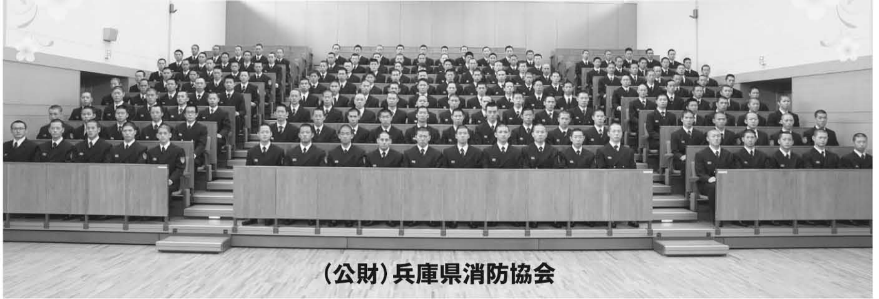
(公財)兵庫県消防協会