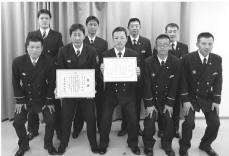
併任解除辞令を受け取った派遣職員の皆さん

平成二六年三月三十一日(月) 県災害対策センター会議室にて、県内各消防本部から派遣された職員の併任解除の辞令交付式が執り行われました。 併任解除辞令と併せて、知事より派遣期間中の功績に対する感謝状が贈呈され、また県広域防災センターへ派遣されていた職員へは、県消防協会長からも、消防団員の教育訓練にご尽力いただいたことに対する感謝状が贈呈されました。 そして平成二六年四月一日(火)、同じく県災害対策セ