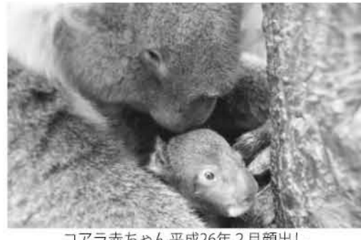
コアラ赤ちゃん平成26年2月顔出し