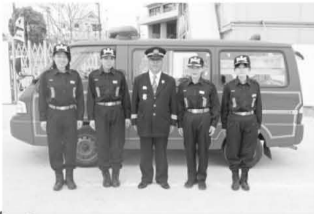
がんばります、洲本市女性消防団員!

日、臨時の団本部役員会を開 催し、平成二五年度中に募集 を開始、平成二六年度から順 次任用のうえ、団本部付けで 配置することで事務処理など を進めていくことが 決定されました。こ のこを踏まえ、一 〇月から募集を開始 する運びとなり、募 集要項の配布、広報 すもとへの掲載、地 元ケーブルテレビで の放送(副団長が出 演し募集の呼びか け)、記者クラブへ 情報提供を行いました。 募集した結果、 熱意のある四名の女 性が応募され、平成 二六年度から女性消 防団員として活動し ていただくこととな