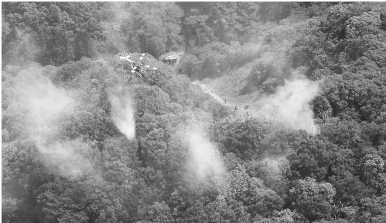
林野火災におけるヘリコプターによる空中消火（※写真は本文中の林野火災とは無関係です）