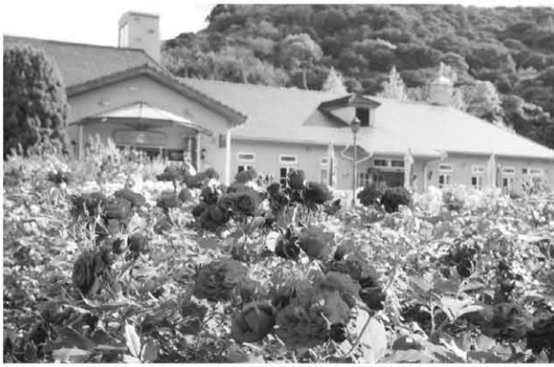
イングリッシュローズガーデン5月中旬見頃

館で行って いますので インگران ドの丘にお 越しの際は 素敵な名前 を考えてく ださい。 また、グ リーンヒル エリアでは 世界各国の 植物を栽培 している大 温室や数多 くの山野草 が育つロッ クガーデン があり、珍 しい植物を 栽培してい ます。 休日は、ぜひ自然や動物と のふれあい体験ができるイン グランドの丘で日常を忘れて 一日のんびりお過ごしください 。皆様のお越しを心よりお 待ちしています。