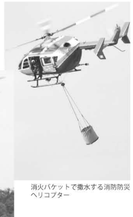
消火バケットで撒水する消防防災ヘリコプター

本年は乾燥気象が続き、五月以降、大規模な林野火災が相次いでいます。五月八日には三木市から小野市にかけて、雑木林を焼損する火災が発生しました。一日には赤穂市で安易な火の不始末から約七〇ヘクタールの森林を二日間に渡って焼損する火災が発生。消防車のべ六一台が出動し、多数の消防団員、消防職員による消火作業が続けられました。また、兵庫県、岡山県、自衛隊のヘリコプターのべ七機が、火災現場近くの千種川でホバリング（空中停止）しながら水を汲み上げ、ピストン運航で空中消火にあたりました。