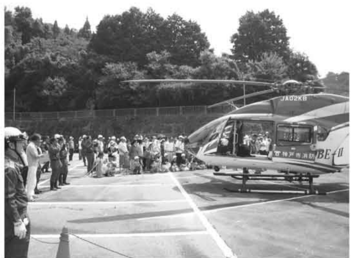
自主防災組織と連携した防災訓練