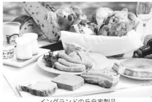
イングランドの丘自家製品

淡路ファームパークイング ランドの丘は、イングランド の湖水地方をイメージした農 業公園です。エリアが二つに 分かれており、その広さは甲 子園球場の一六倍あります。 グリーンヒルエリアでは、コ アラをはじめ、ワラビーやう さぎ、カビバラなどたくさん の動物に出会えます。コアラ 館は日本で一番多くのコアラ 九頭を飼育している施設です。 今は昨年八月に生まれた赤 ちゃんコアラが二月頃より母 親の袋から顔を出しはじめて います。赤ちゃんコアラの名 前募集を六月一日までコアラ