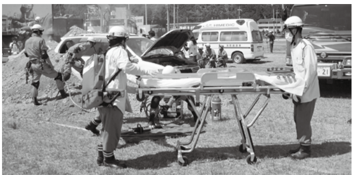
土砂崩れにより埋没した車両からの救出