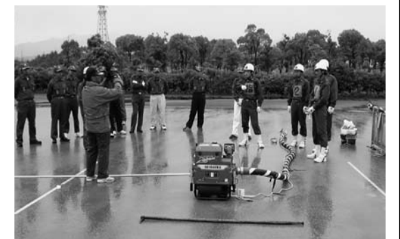
一日入校で雨中での指導教官の熱心な指導を受ける隊員

その篠山市消防操法大会は、県大会の約一ヶ月前の七月四日(日)の梅雨の最中の天候が心配される時期に、待望のアスファルト舗装のなった「篠山市消防本部訓練場」において開催しました。