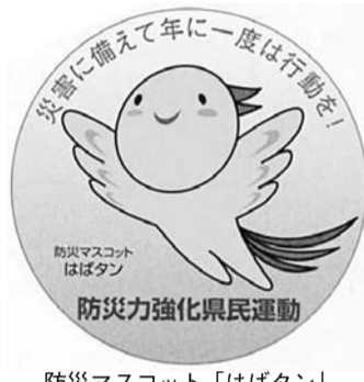
防災マスコット「はばタン」