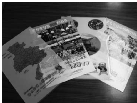
消防団啓発クリアファイル・リーフレット

なお、このクリアファイル・リーフレットはこれまで各消防団のPRグッズとしても活用ができましたので、団員募集のPRに活用を希望される場合は事務局を通じて県協会までご連絡ください。