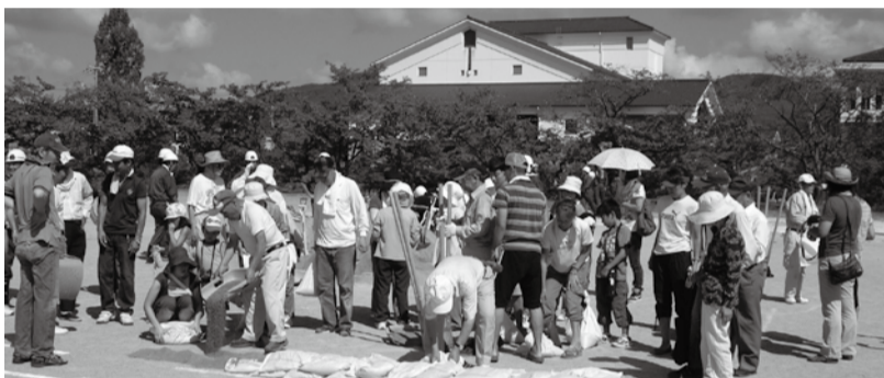
住民による土のう積み訓練