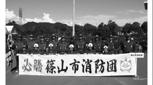
県大会に出場した第11分団の面々

当日は、天候に恵まれ、応援を含めた約八五〇名もの消防団員の参加で会場が狭く感じられる中、小型ポンプの部一八隊、ポンプ車の部三隊の計二二隊で競い、小型ポンプの部県大会出場隊を選抜しました。