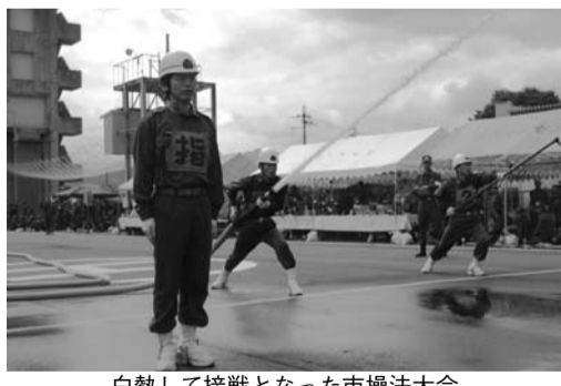
白熱して接戦となった市操法大会

県大会で操法を披露する第一分団の隊は、七月二三日(火)に兵庫県消防学校の教官による一日入校で、特に、指導教官により具体的な指導に、隊員は大変貴重なものを持ち帰ることができ、県大会までの残りの日の練習に効率よく打ち込むことができたところでした。