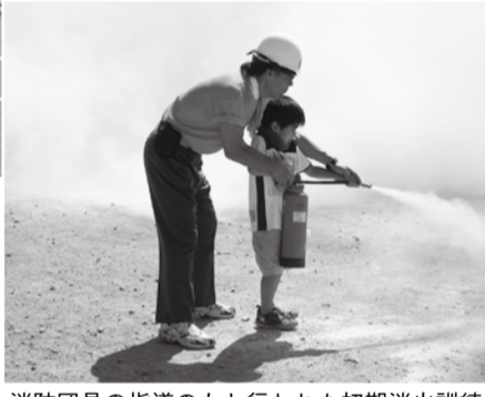
消防団員の指導のもと行われた初期消火訓練