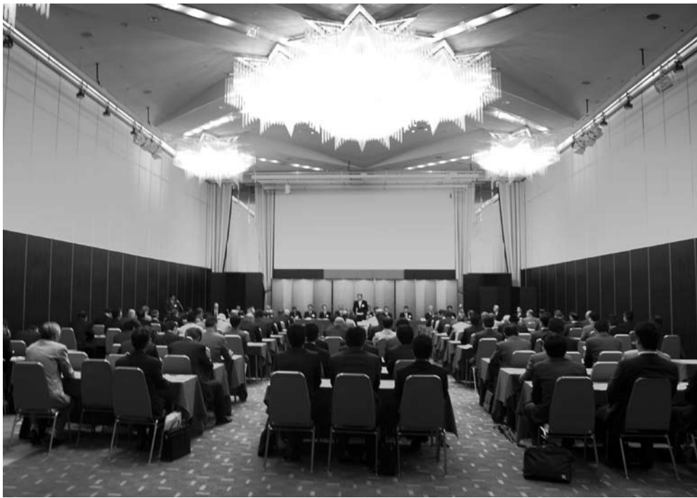
平成 22 年度理事会・代議員会