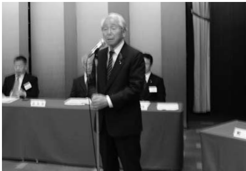
井戸知事あいさつ