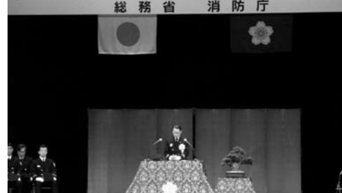
5月13日に開催された伝達式の様子