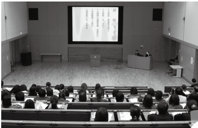
平成21年度女性消防団員研修会の様子

消防団員の確保に向け、平成一九年より消防庁において、団員確保に必要な知識又は経験を有する消防団員・職員等を「消防団員確保アドバイザ」として、県、市町(消防本部)に派遣し、団員確保の推進を図るために具体的な方策に関する助言、情報等の提供を行う制度が実施されております。既に、県内でもいくつかの消防団ではアドバイザ派遣制度を活用した実績があり、いずれも好評でした。県協会においても、昨春秋に兵庫県広域防災センターにおいて実施した「女性消防団員研修会」の際にも本制