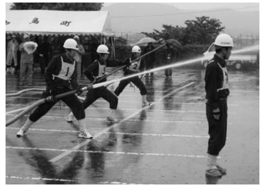
北播磨地区で最初に実施した「小野市消防操法大会」の様子

特に今回は、兵庫県から「小型ポンプ操法の部」が全国大会へ出場できることとなっています。現在も、その「全国大会出場」という切符をまぎ取るために北播磨地区の各市・町の消防団員は消防操法の練習に励んでおられます。