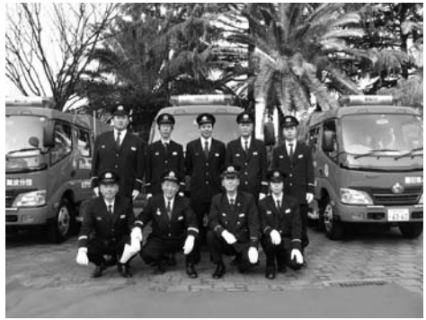
勝っても・負けても 虎命!

そこで、お酒も入って和気藹々の雰囲気の中、すべて「グウ(よ。(good))」となり最高の気分、六甲おろしを口ずさみながらお帰りになります。井内団長の言葉として、団長