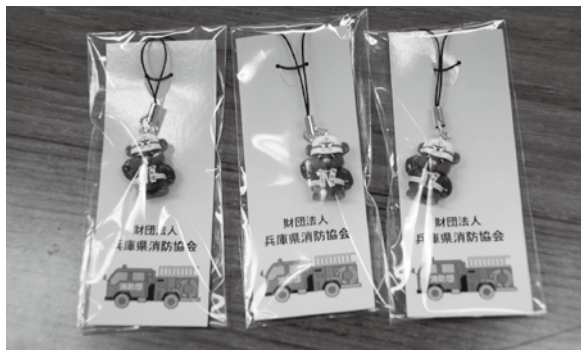
消太くんストラップ

この度、県消防協会にて本協会のマスコットである「消太くん」のストラップを作成しました。 このストラップは愛らしい「消太くん」に加え、台紙に消防車を載せたことで、一際目止まる仕上がりになっており、他にはあまり例を見ない消防団啓発グッズです。 先日開催されました理事会・先日開催されました理事会・代議員会において、県事務局よりこの「消太くん」ストラップについて報告し、今後は各支部を通じて配布される予定となっております。