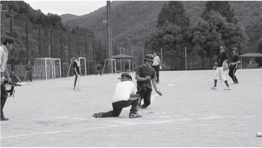
白熱した試合が行われた