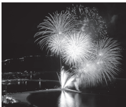
第62回 淡路島まつり「花火大会」

本市消防団では、この歴史ある二つの「まつり」を安全に楽しんでもらうため、また、「まつり」開催中の火災等に即対応できるように、期間中、警戒出動として延べ約一七〇名の団員により、市民、参加者の安全確保に努めています。