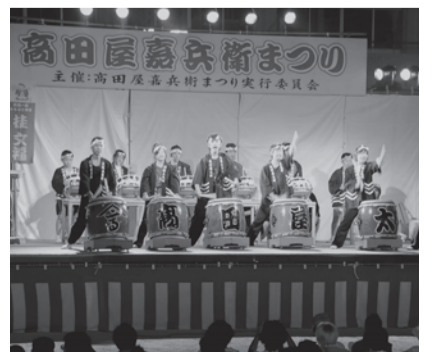
昨年の高田屋嘉兵衛まつり「高田屋太鼓」