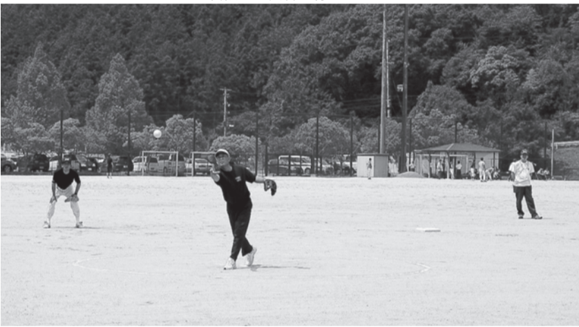
団長・副団長も大活躍