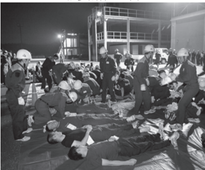
大規模災害訓練・トリアージ

者が出る集団災害事故を想定し、治療の優先順位を決めるトリアージ訓練や救出訓練、応急処置訓練を行いました。現場の指揮を取った教育生の感想は「情報収集がうまくできなくて、指揮することの難しさを学びました。この経験を生かし、迅速な現場対応ができるよう訓練に励みます」。また、山林火災を想定した林野火災訓練、積み土のう工法を行う水防訓練、搬送訓練を実施しました。限られた