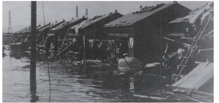
道意町県営住宅の被害状況

団が両輪のごとく一致団結が不可欠であり、また消防団と密着した地域住民の防災に対する理解と協力により、地域力をより強くしてこそ、あらゆる災害から市民の生命、身体、財産を守