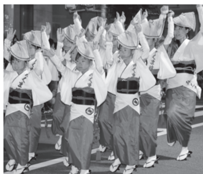
第62回 淡路島まつり「おどり大会」