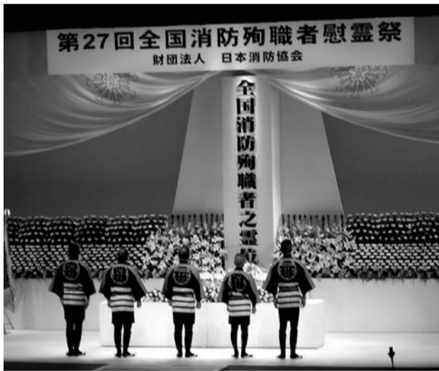
第27回全国消防殉職者慰霊祭

第二七回全国消防殉職者慰霊祭が日本消防協会・全国消防殉職者遺族会の主催により、九月十一日(木)午前一〇時より東