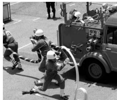
完成度も上がって...

各都道府県より勝ち進んで来た選手の見事に訓練された動きに、操法を初めて見た団員には、驚きとともに、自分出来るのかと不安な気持ちも少し芽生えましたが、見学終了後、地元に戻り、食事を催した際、お酒を飲んだせいもあるのか、思いは一気に全国大会へと盛り上がりました。