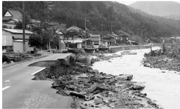
台風23号で崩壊した国道

あと一年という消防団にとっても激動の時期でした。近隣自治体は合併時に消防団一団制を採用する中、一市五町の消防団をどうするのか。地域住民の安全安心を確保するための組織とはどのようなものか。激論に激論を重ね、紆余曲折がありました。が、新市は七〇〇名と広範囲であり、海岸部、平野部、山間部と異なる地形を有し、災害時の形態や気象状況も多様であることから、多団制とし、旧市町の消防団をそのまま新市に引き継ぐこととなりました。