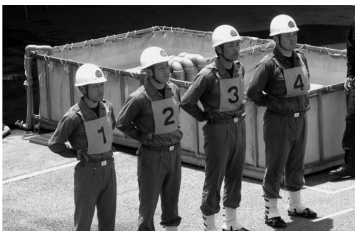
目指せ! 最下位脱出

淡路市消防団は旧津名郡五町の消防団が統合し、発足しましたが、旧津名郡時代は、操法大会出場チームは、各消防団が、順番に出る事となっており、今回もそのルールによって、小型動力ポンプの部は、北淡地区浅野分団、消防ポンプ自動車の部は、東浦地区自動車分団が出場