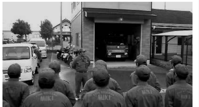
火災警戒・警備巡回開始!

また、八月十六日に旧美囊郡吉川町で開催されました「夏の市民ふれあいまつり」吉川ふるさと花火大会」においても、吉川地区消防団が出動し、中西団長以下団員四〇名が花火による出火警戒を実施しました。