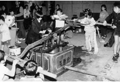
小学生の体験風景