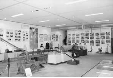
消防展の展示風景