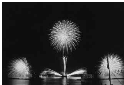
竹野浜海上花火大会